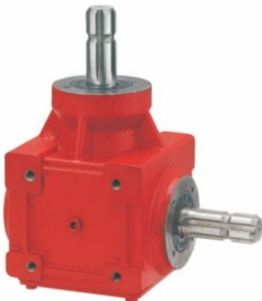
HN-BGB9 Prenosni odnos 1:1 Cena 181.00€ + pdv