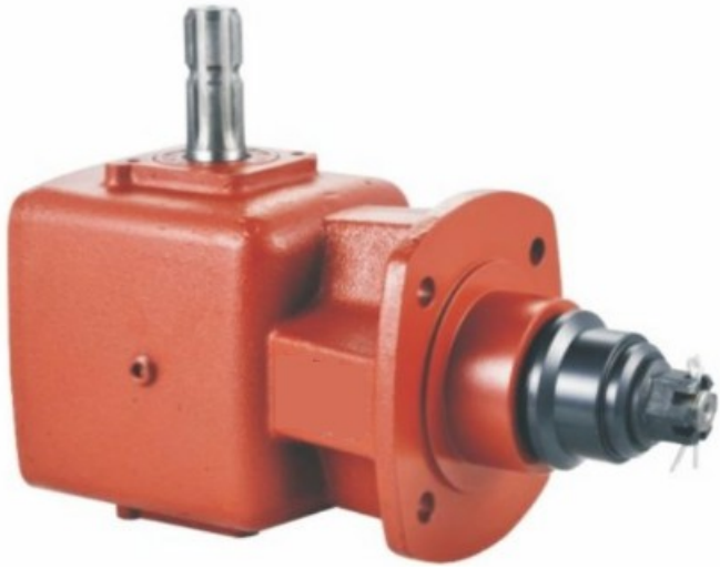
HN-SQ55 Prenosni odnos 1:1.6 Cena 205.00€ + pdv