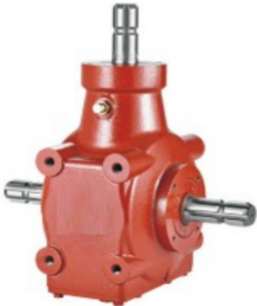
HN-2071 Prenosni odnos 1:3 Cena 261.00€ + pdv