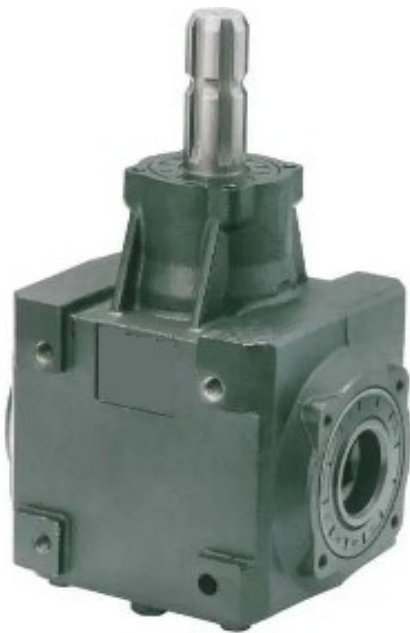
HN-01-672 Prenosni odnos 1.47:1 Cena 127.00€ + pdv