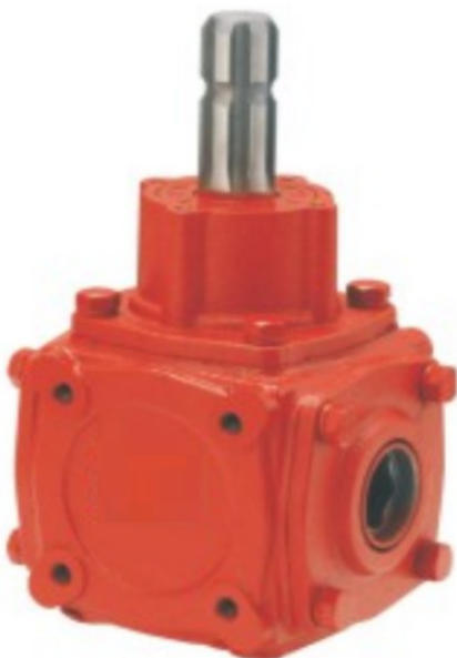
HN-259 Prenosni odnos 1.46:1 Cena 124.00€ + pdv