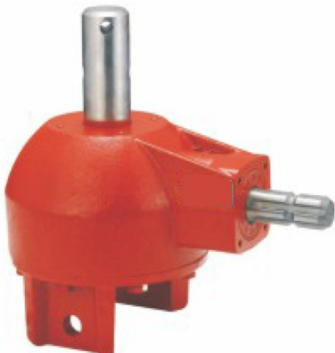
HN-GT40U Prenosni odnos 3:1 Cena 194.00€ + pdv