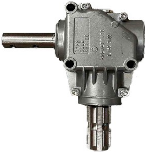
HC-RV 010 Prenosni odnos 1:1 Cena 49.00€ + pdv