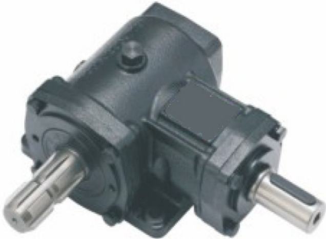
HN-30 Prenosni odnos 1:2.9 Cena 118.00€ + pdv