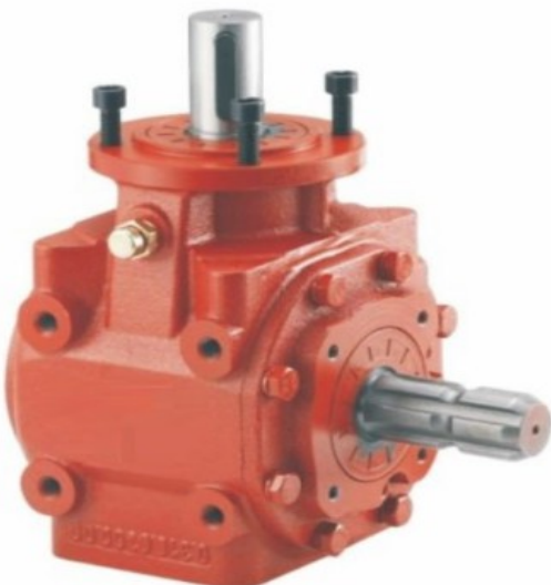
HN-310 Prenosni odnos 1:3 Cena 151.00€ + pdv