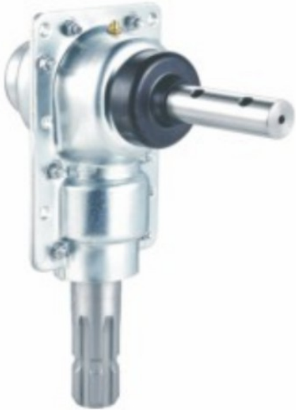
HN-01.229 Prenosni odnos 1:1.35 Cena 56.00€ + pdv