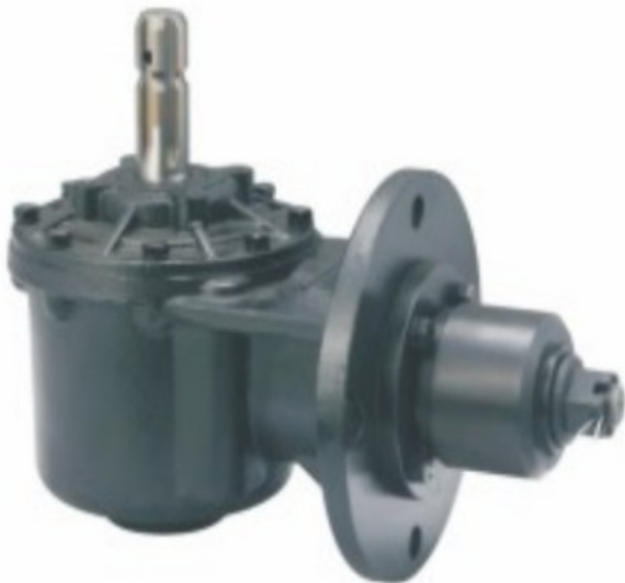
HN-966109 Prenosni odnos 1.46:1 Cena 315.00€ + pdv