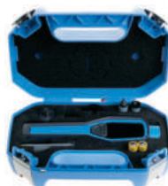
TKRT 31 Digitalni tahometar 682.00€