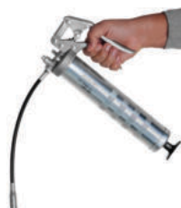
LAGH 400 Pištolj za podmazivanje 41.00€