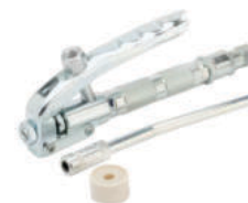
LAGG P1 Rezervni pištolj pumpe za mast 169.00€