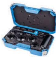
TMFT 36 Komplet alata za montažu ležaja 414.00€