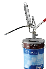
LAGF 18 Pumpa za punjenje masti 210.00€