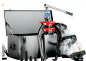
TMMA 100 H Set 936.00€