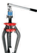
TMMA 75 H Hidraulični radapciger 769.00€