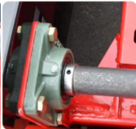
Ležajne jedinice za velike brzine, povišene temperaure i za duži vek trajanja

Daljinsko upravljanje omogućava rad sa udaljenosti do 300-400 metara (bez opasnosti na padinama ili neravnom terenu). Intuitivne kontrole džojstikom sa bezbednosnim funkcijama automatskog zaustavljanja.