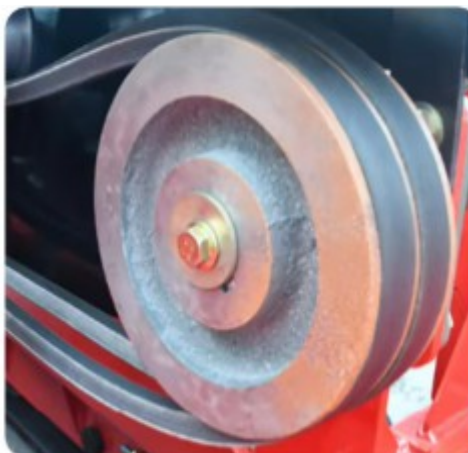
Kaiš od poliestera, veća čvrstoća, otpornost na visoke temperature, dug vek trajanja